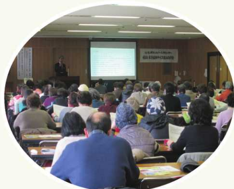
家事援助サービス班研修会