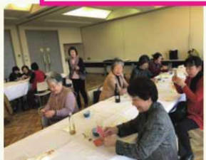
ピンゴゲームやじゃんけん大会で盛り上がりました!