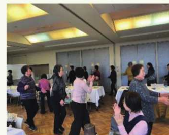
楽しい時間はアツと言う間に終了。 次回は、いつまでも美しく… 「いきいき美容講座」を企画しています!