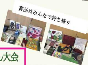
賞品はみんなで持ち寄り