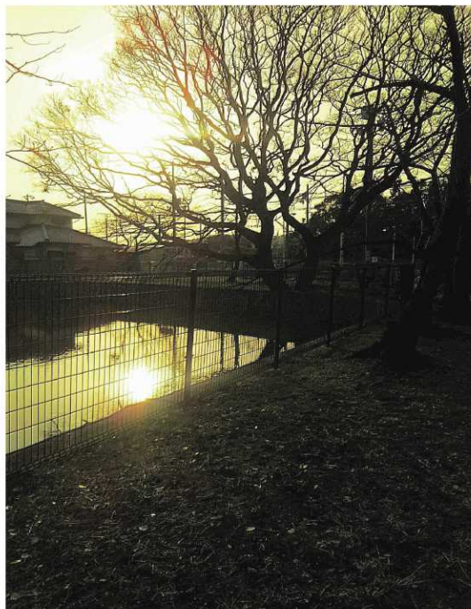
いたすけ古墳の夕日 北ブロック 南 英子