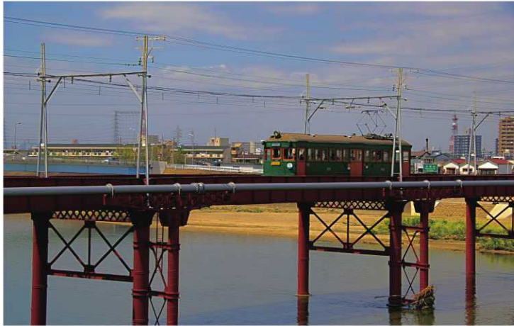
阪堺電車 北ブロック 坂本 昊