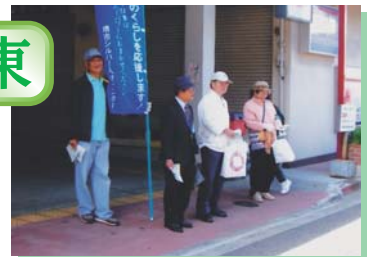
南海高野線 初芝駅周辺