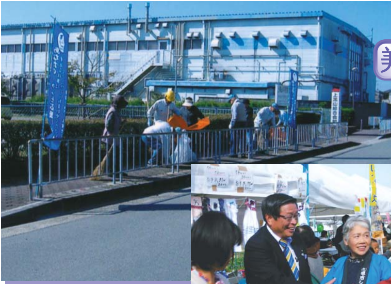
美原保健センター周辺