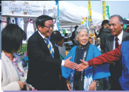
美原区民フェスタで竹山市長から激励される