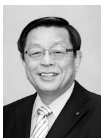
堺市長 竹山 修身