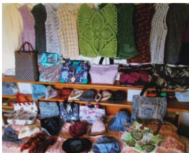
中古素材でつくった格安エコ作品です。

クレス・指輪も合わせると 百点近くの作品になりました。 自宅で「すどおり展」 も開き、近所の若いママさ んたちで賑わい、大好評で した。 こうした機会に多くの とお話ができて大変うれし く思いました。