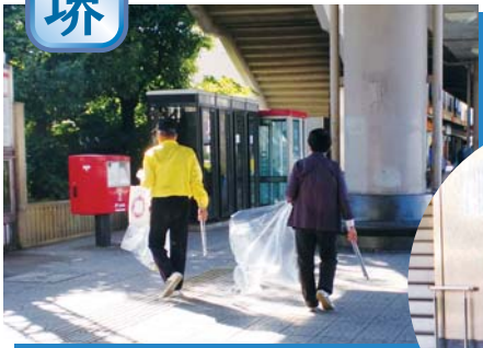
南海高野線 堺東駅周辺