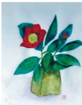
美原ブロック つばき 松下 順子