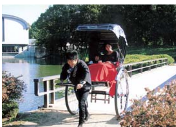
人力車 大仙公園にて