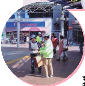
南海高野線 中百舌鳥駅周辺