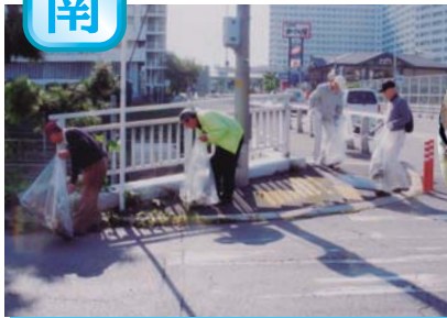
泉北高速鉄道 泉ヶ丘駅周辺