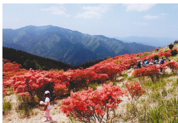
葛城山のつつじ 東ブロック 佐藤俊治