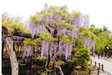
藤の花 東ブロック 佐藤俊治