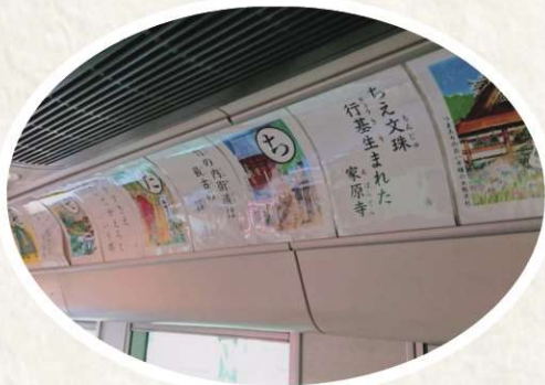
堺トラム特別展示会(美術館) 阪堺電車内

昨今のコロナ情勢に鑑み、子ども「堺かるた大会」も中断せざるを得なくなりましたが、『堺かるた』『続堺かるた』の素晴らしいさを改めてお伝えしたいとの思いから、令和3年8月9月上旬に堺市文化観光局のご協力を得て「堺トラム特別展示会(美術館)」Ⅱ「写真Ⅱ」を企画致しました。