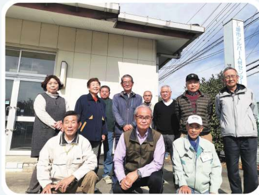
世話人、副世話人の皆さん

配布班は堺市の各区ごとに7班に分かれています。班ごとに世話人、副世話人が1人ずつおり全区合わせると100〜150人くらいの会員が配布のお仕事をしています。仕事は主に企業や団体等からチラシ配布のご依頼を受けています。