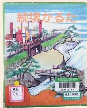
続堺かるた (堺市立図書館所蔵)

はじめ、伝統行事や伝統産業、歴史上の著名人たちを紹介するため、分かりやすいことばのリズムを持った読み札と、豊かな未来を創造した色彩の絵札で構成された「あいうえおかるた」です。