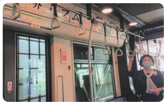
堺トラム特別展示会(美術館) 阪堺電車内