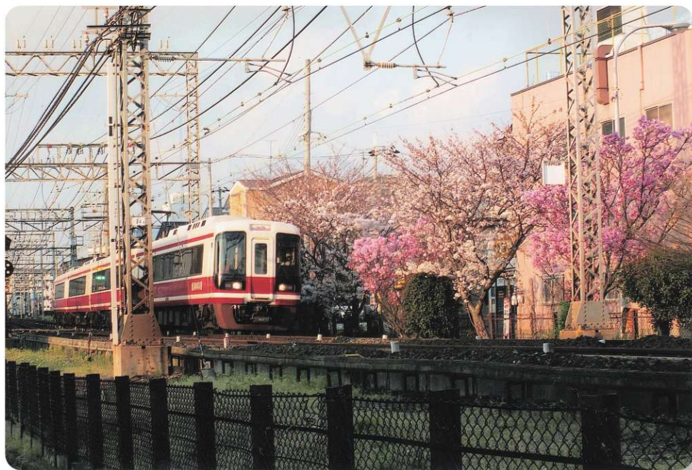
桜を左に見て(中田出井町) 南海電鉄 31000系 特急「りんかん」号 堺ブロック 井村 勉