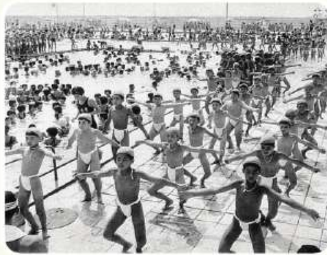
ふんどしでの授業風景

あり、1966年からクロールを基本泳法にしました。以来研究を重ねて1976年にプール授業法を網羅した『指導教本』を発行しました。 また夏の風物詩だった男子の禪（ふんどし）は1965年に海水パンツへと改められました。