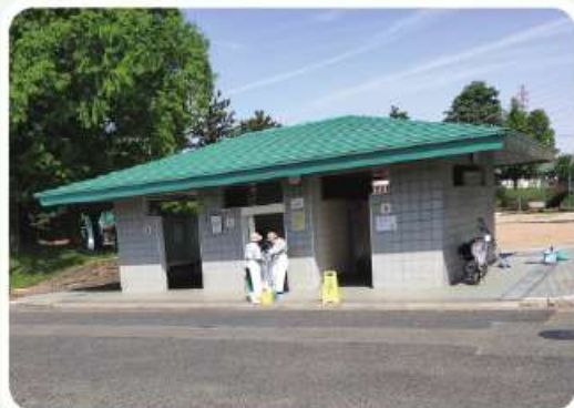
大泉緑地トイレ清掃

大仙公園には7カ所のトイレがありますが、シーズンやイベントにより臨時のトイレも用意されます。清掃は毎日、年末年始の休み以外は休まず行っています。6人がシフトを組み、2人ずつで9時から12時までの業務です。道具は現場に備わっていますが、トイレトッパーは持って行き追加します。 建物内部の清掃と外のゴミ拾いもします。秋には落ち葉が便器の中まで、はまり込んだりして大変なこともあります。また時にマナーの悪い人がいたりして汚れのひどいときもあります。皆で協力しあってやっています。 金岡公園には4カ所のトイレがあります。毎週月金の9時から12時に2人で作業しています。 公園を楽しく使ってもらうために大切なトイレですから、丁寧に掃除しています。寒いし、暑いし、きれいでない、たいへんな仕事ですが、喜ばれるのがいいことです。 会員さんが一生懸命にやっているの、「お掃除現場に出会ったら声掛けがあればうれしい」と堺・北分室の職員の話でした。