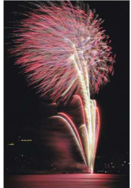
花火 手習い、北ブロック 森井 忠