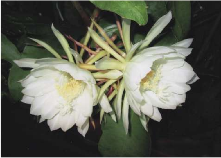
月下美人 西ブロック 三村 秀明