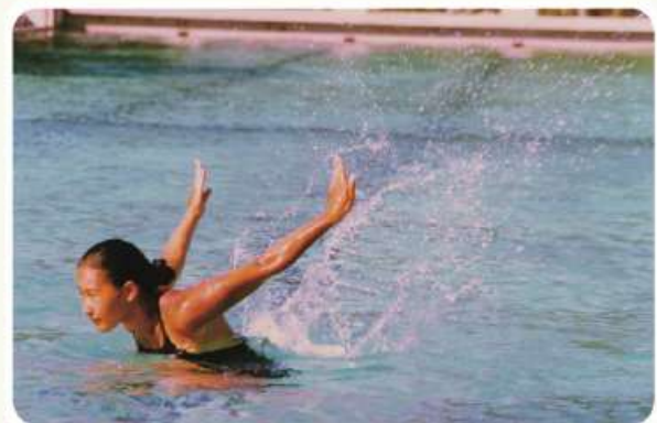
能島流泳法の一つ「舞鶴」

この泳ぎの習得は水難事故から自分自身を守る術となりまた救助を待つこともできます。