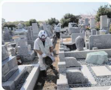
水はけ対策の砂利補充は苦情処理の作業

この公園墓地の維持管理業務は6年前に公園協会から当センターが受け継ぎました。現在は会員46人（男性21、女性25）が機械や手引きによる除草と園内のゴミ回収や枯れ木と枯れ花の除去のほか、利用者の苦情処理にあたっています。