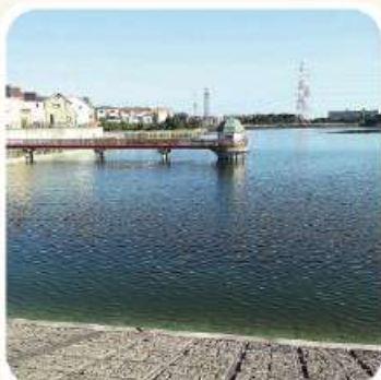
ウォーキングコースの光明池

そこでウォーキングのルートを工夫して、所要時間4時間で約2万3千歩の和泉市方面、約2時間で1万8千歩の泉ヶ丘や野々井橋周辺、さらに1時間余り5～6千歩の近隣など5コースを決めました。そしてその日の体調と気分で選び脚力の低下を防いでいます。