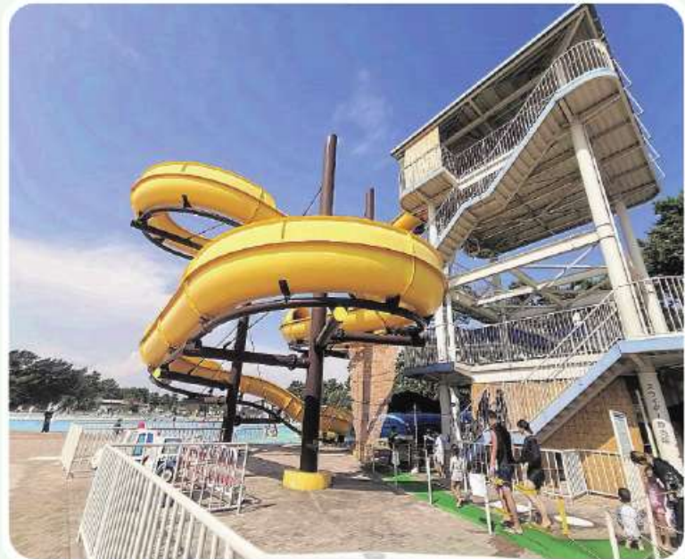
そびえたつスライダー 3階の高さから滑り降ります 2コースあります

今年の夏は、「災害級の猛暑」と何度も耳にしました。そんな中、浜寺プールにはスライダー施設運営の職人、わがセンターの12人衆が利用者の安全を守る業務に日々奮闘していました。 業務内容は、開場1時間前の準備に始まり利用者への発券・改札・案内が主になりました。 今年の夏は、「災害級の猛暑」と何度も耳にしました。そんな中、浜寺プールにはスライダー施設運営の職人、わがセンターの12人衆が利用者の安全を守る業務に日々奮闘していました。 業務内容は、開場1時間前の準備に始まり利用者への発券・改札・案内が主になりました。