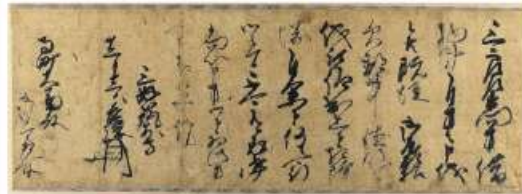
三好長慶書状 天文18(1549)年 京都市歴史資料館所蔵

右は、長慶の書状で、この頃出された徳政の適用範囲には堺を含まないと記されており、権力者が堺に一定の配慮を示していたことが分かります。