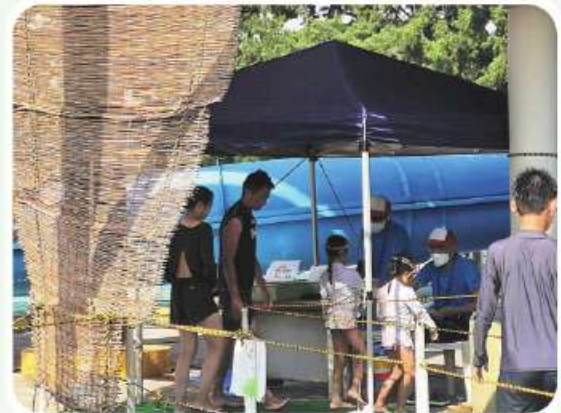
スライダー券拝見します