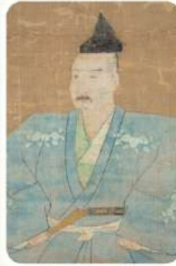
三好長慶像(部分)

三好長慶(1522～1564)は、戦国時代に活躍した武将。阿波国(今の徳島県)の出身。