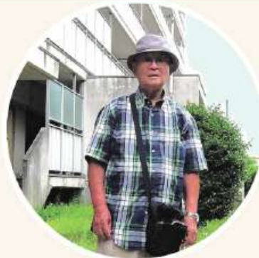
自宅のある高層住宅の前で