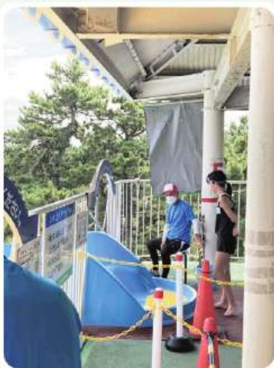
スタート地点です お客さまに「いってらっしゃーい楽しんで！」とお声かけ ディズニーランドのキャストさんみたい(笑)

発注者さまからも「本当に頼りになる方々。来年もぜひお願いしたい」と称賛です。 12人衆の皆さん、猛暑のなかでのお仕事本当にお疲れさまでした。