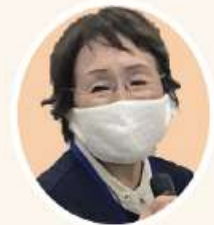
川上さん 北ブロック アプリ使用開始 7月中旬