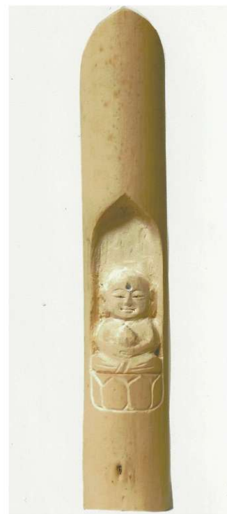
地藏菩薩 西ブロック 塚本 武男