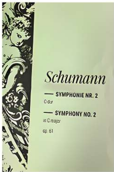
シューマン交響曲第2番の表紙

それにしても最近のカラオケはすごい。驚異的なライブライリー数を有し音も良く正直な点数も出る。かなり真剣に歌わないと各曲の全国1位になれない。昔々の歌しか知らなかった私は、楽譜を図書館から借りてきたり、ブックオフで買ったり、借りてきたCDなどから採譜したりして、レパートリーを拡げていきま