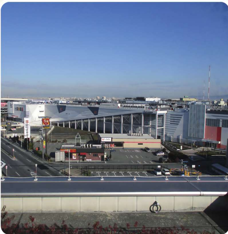
美原区役所屋上から「ららぽーと堺」を望む

この「ららぽーと堺」には約220店舗が出店しており、のどかな田園風景が広がる美原の街並みが一変しました。