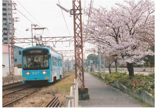
阪堺線 浜寺公園付近 堺ブロック 井村 勉