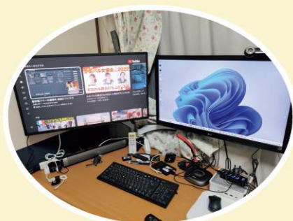
左側モニターは、Youtube、AmazonPrime専用 右側は、PC用